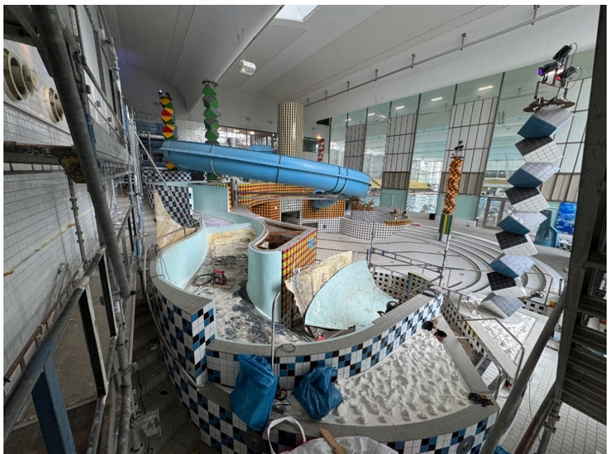
Äventyrsbadet, delar av blå vattenrutschkana är nedmonterad.