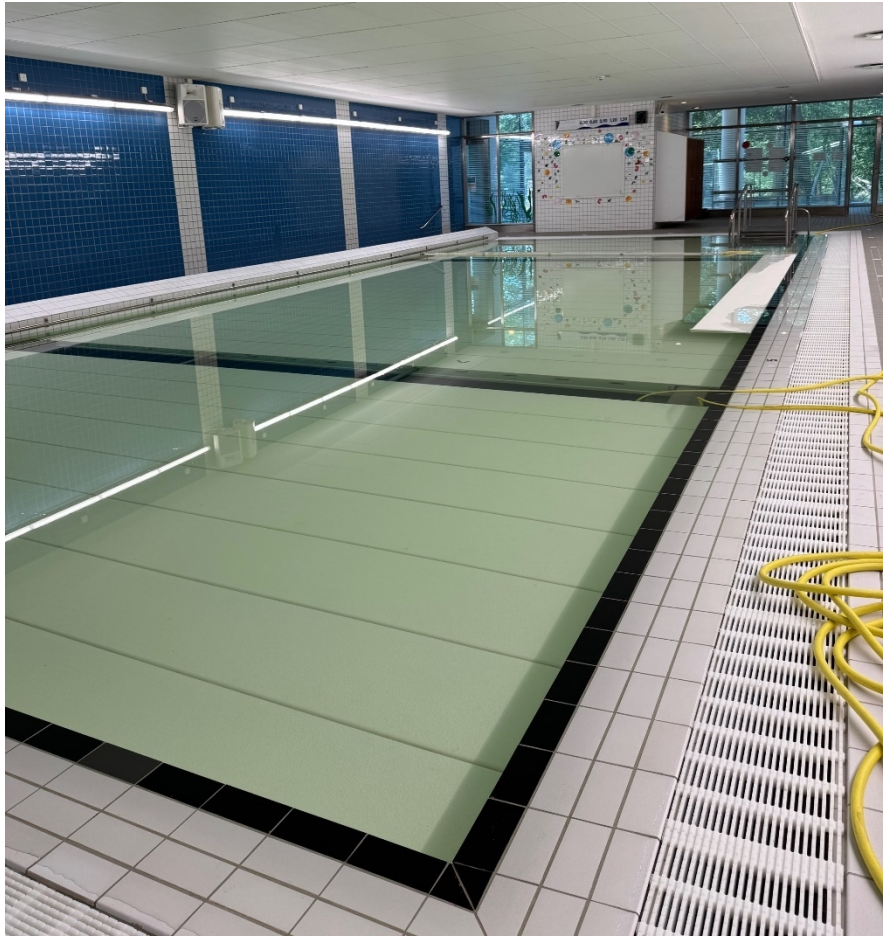
Undervisningsbassäng med höj- och sänkbar botten, i delvis upphöjt läge. Bilden visar pågående fyllning av bassäng.

Hoppbassängen har fått nytt undertak, ny belysning och ljusanordning har setts över. Ventilationen är justerad och trasiga delar har bytts ut. Konstruktionsskador har åtgärdats på bassängkonstruktion från källarplan. Vid och i hopporn har mer omfattande konstruktionsskador uppmärksamats och omhändertagits.