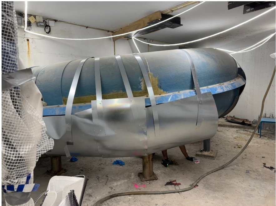
Stålskyddsinklädnad vid vattenblästring, betonggolv har bilats bort och kommer återställas.

I källarplan har betongkonstruktioner vattenbilats. Utredningar från konstruktören har legat till grund för omfattningen av bilningen. När entreprenören var klar med vattenbilningsåtgärderna var konstruktören på plats och säkerställde att omfattningen varit korrekt innan processen gick vidare.